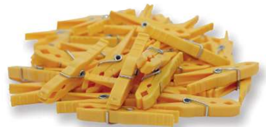
19010 / 19011