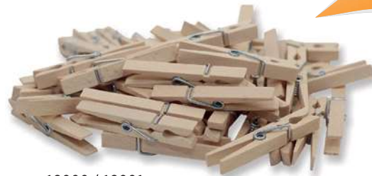
19000 / 19001