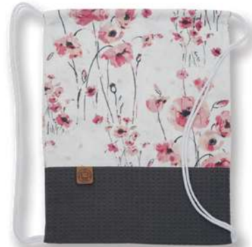
18411 mit Waffelpiqué